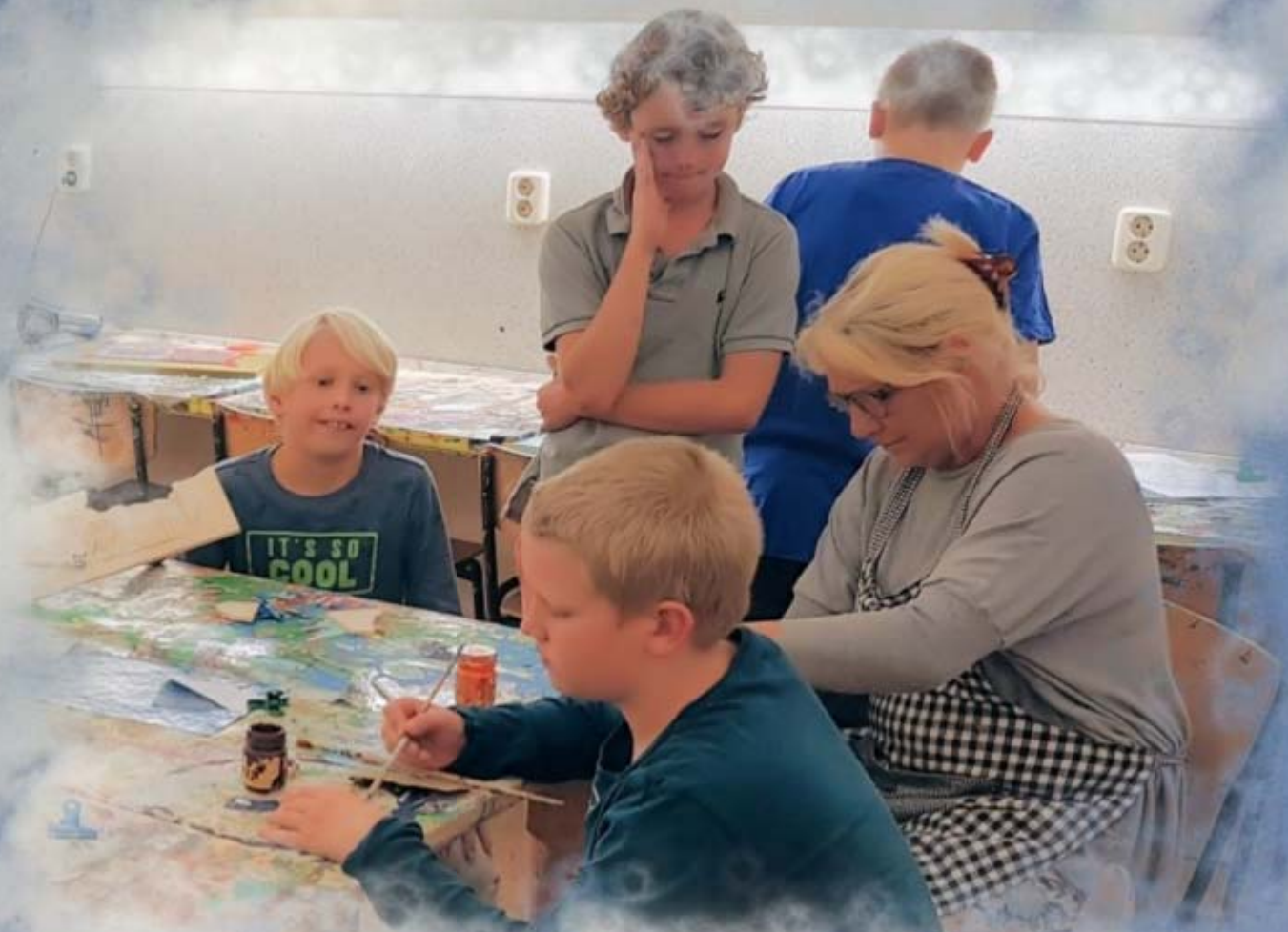
Dinsdag 26 september 2017